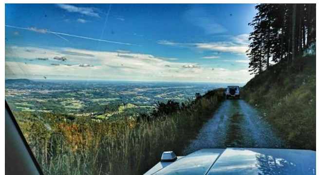
Text: Marcus J. Walker