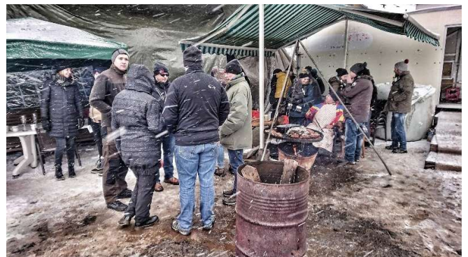
Text: Marcus J. Walker

Nach leckerem Kaffee und Kuchen ging's für alle wieder in die warmen Autos auf den Weg nach Hause.